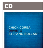
Chick Corea & Stefano Bollani: Orvieto